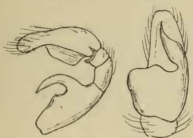
Fig. 3 et 4.

patellis tibiisque fusco-castaneis subtus dilutioribus, metatarsis fulvo-rufulis, tarsis luteis, pedes sex postici coxis femoribusque nigricantibus vel olivaceis reliquis articulis flavidis, patellis tibiisque quatuor posticis apice anguste fusco-annulatis. Pedes 1 i paris tibia metatarsoque pilis longissimis et tenuibus sed parum densis munitis, tibia aculeis interioribus trinis validis et leviter uncatis,